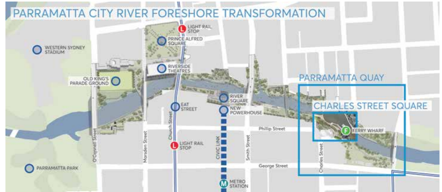
찰스 스트리트 광장 기본 설계안은 시드니의 중심적인 강변 도시라는 파라마타 시의 비전을 실현하기 위한 일련의 혁신 사업 중 첫 작업에 해당합니다.

2022년 완공 계획인 찰스 스트리트 광장 개선공사는 파라마타 시의 야심찬 파라마타 강 개발 전략에 따라 이루어지며, 파라마타 키 재개발과 파라마타 강변 개선사업에 대한 지속적인 투자의 일환으로 진행됩니다.