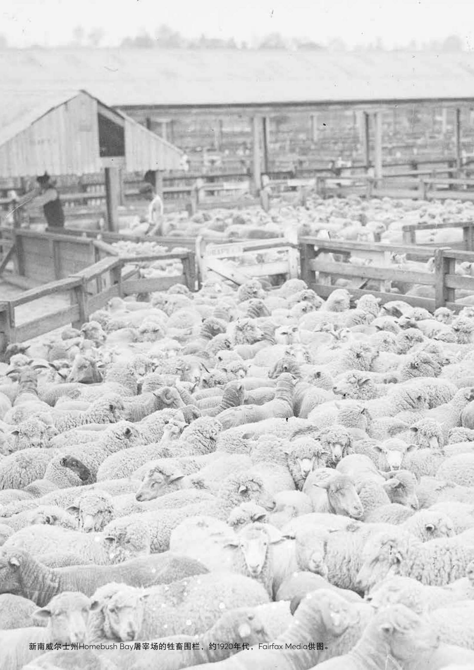
新南威尔士州Homebush Bay屠宰场的牲畜围栏，约1920年代。