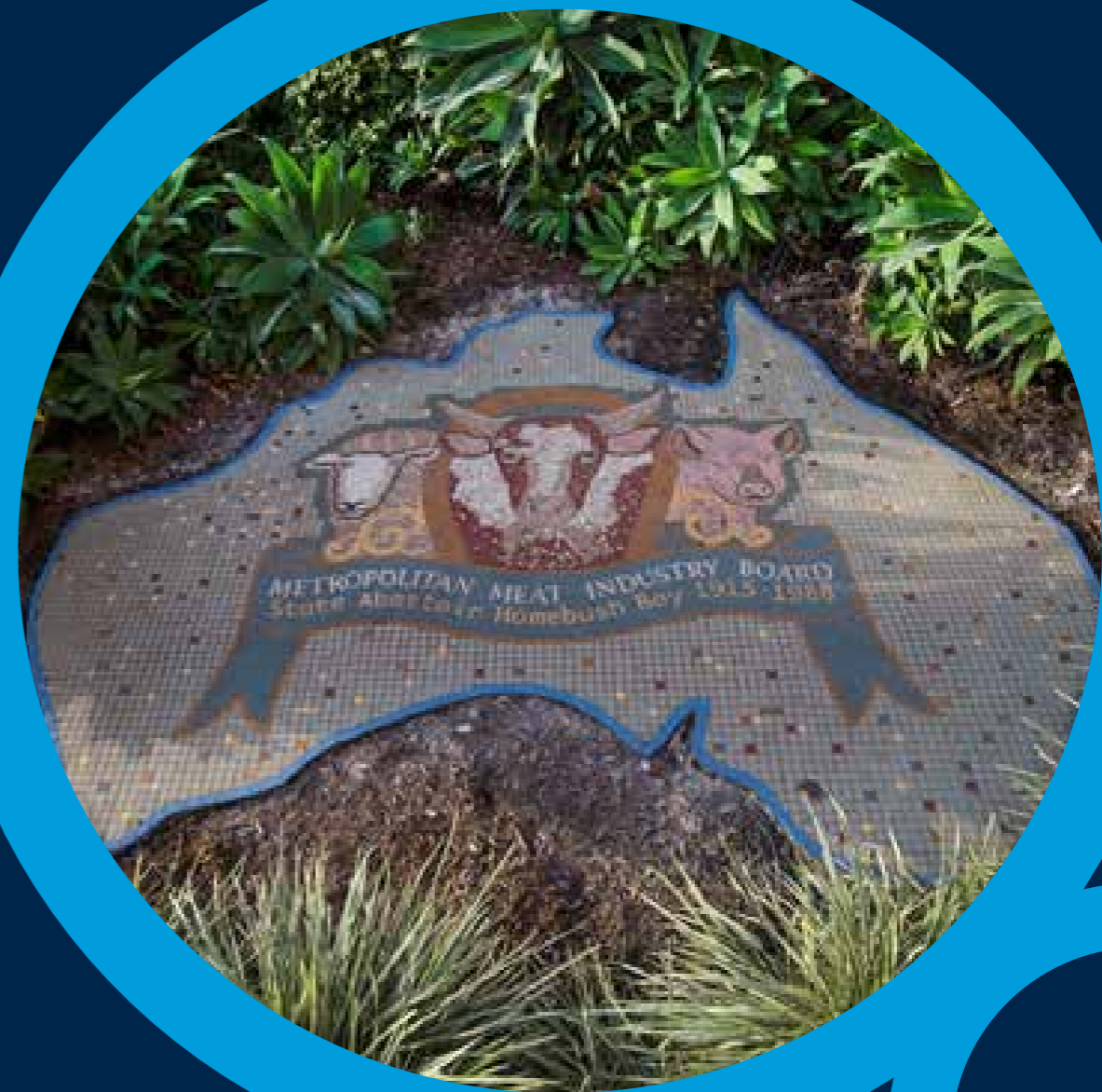
州立屠宰场的马赛克纪念牌，悉尼奥林匹克公园， 摄影师Paul K Robbins。

https://dictionaryofsydney.org/entry/lidcombe