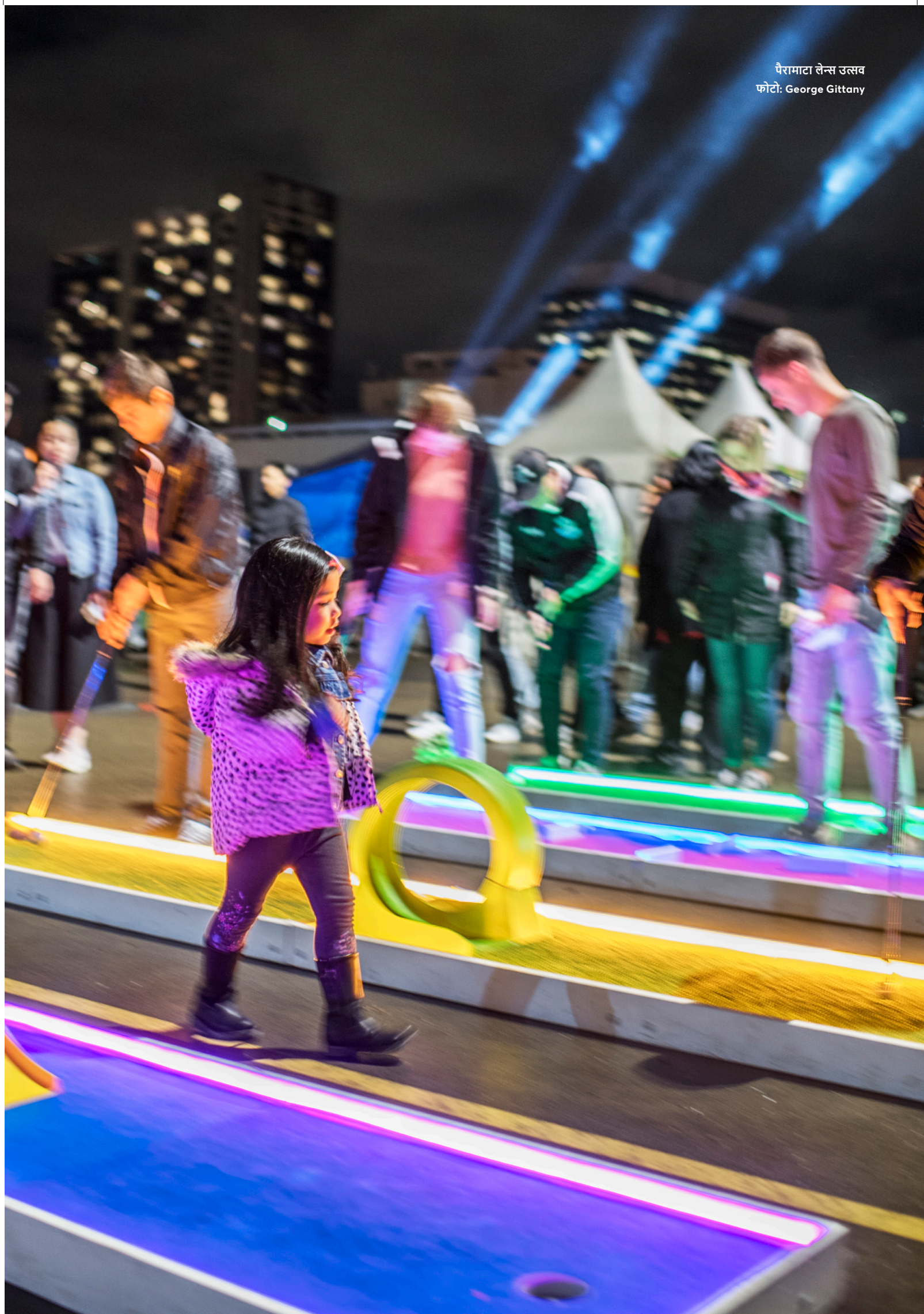
पैरामाटा लेन्स उत्सव