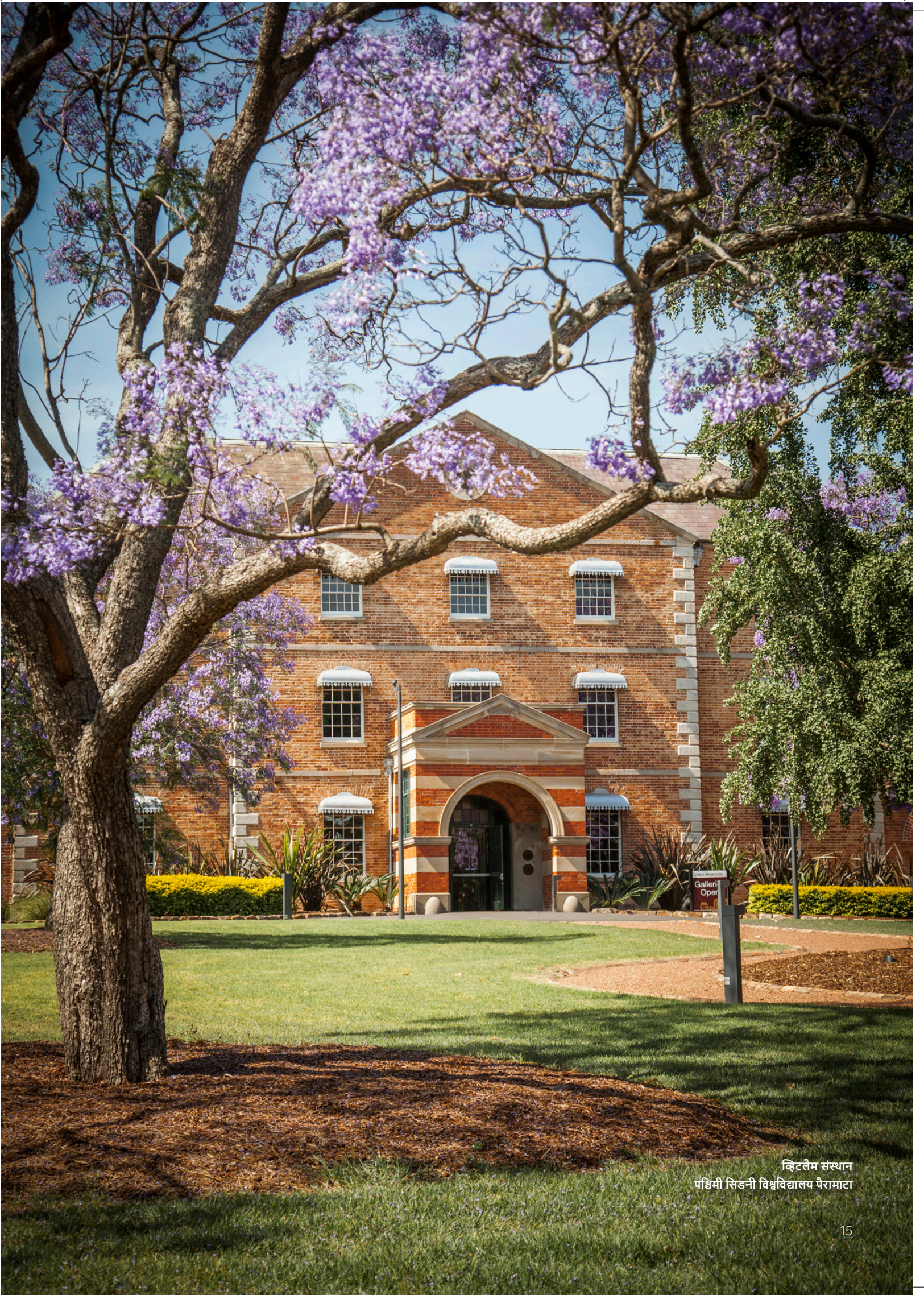
डिटलैम संस्थान पश्चिमी सिडनी विश्वविद्यालय पैरामाटा